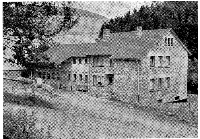
Hof Karl Spieker-Siebrecht, Ottbergen

Bei stetem Fleiß und Mühe kann man mit dem Vermögen zufrieden sein.